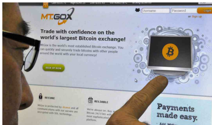
Le site MtGox... avant qu'il ne disparaisse des écrans.

« Ce qui arrive avec MtGox n'est pas une surprise pour tout le monde. Lorsque j'ai débuté avec le bitcoin, on m'avait déjà averti que le site n'était pas très trans-